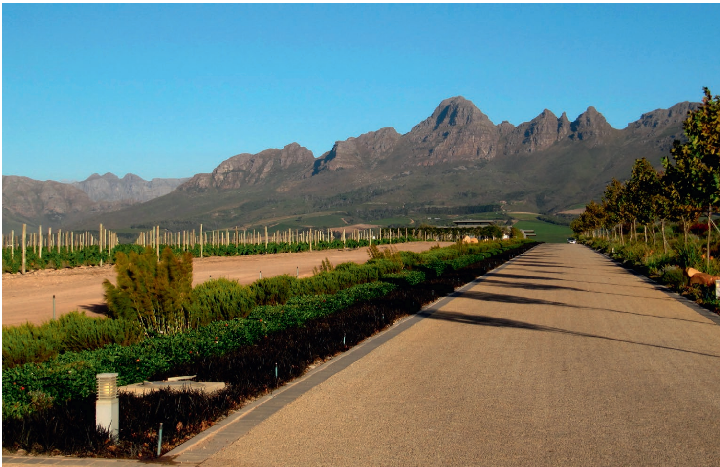
Vaade Heidelbergi mägedele.